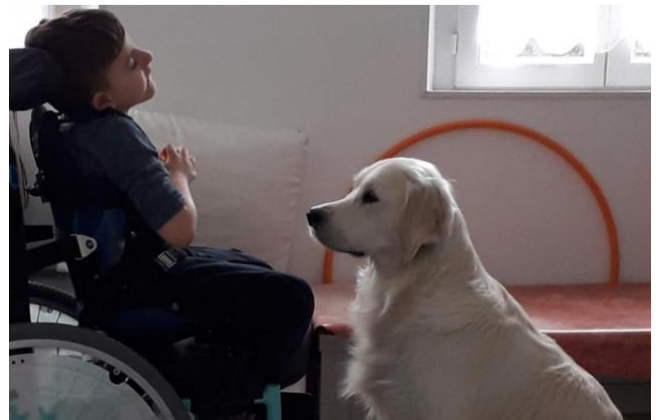
Photo on the right: The golden retriever dog was trained by the Handi'chiens association